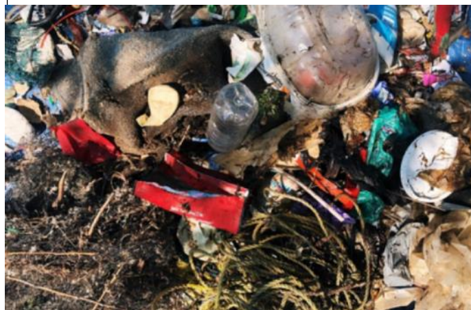
Images prises lors d'activités de nettoyage de berges