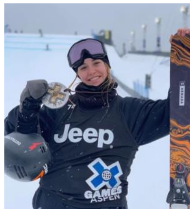
Photo : courtoisie Olivia, médaillée de bronze aux X-Games 2022 à Denver, au Colorado.

Quelques semaines plus tard, Olivia a fait ses débuts olympiques à l'épreuve du big air . Après s'être qualifiée pour la finale avec une onzième place, elle a amélioré son sort grâce à une superbe prestation, terminant huitième au classement final. Pas mal du tout pour une première expérience olympique, à 17 ans seulement ! Mais ça ne s'est pas arrêté là, une semaine plus tard elle prenait part à l'épreuve de descente acrobatique, ou slopestyle , et se qualifiait encore une fois pour la finale avec une onzième place. Des problèmes de santé l'ont cependant forcée à abandonner après une première descente lors de la finale de cette épreuve, conservant toutefois son onzième rang.