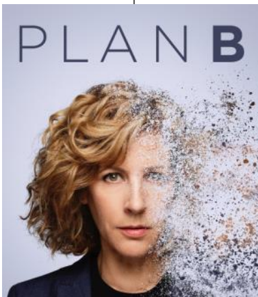
Sophie Lorain, vedette de la saison 2 de Plan B.