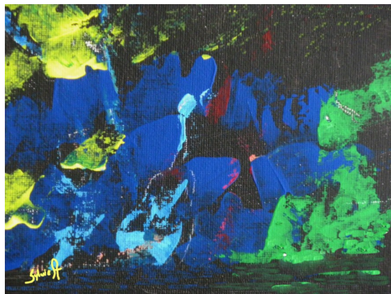
" FILLE AU VIOLON " Exprimer notre perception des choses