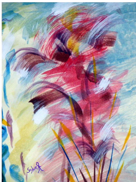
" QUENOUILLE " Danser avec le vent comme avec la vie

Joyeux Noël et Bonne Année à tous les Asselin et à leurs familles !