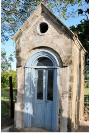
Oratoire dédié à St-Antoine à l'Habitation Paquemar

L'Habitation Paquemar était pour tous un lieu de vie accueillant et hospitalier.