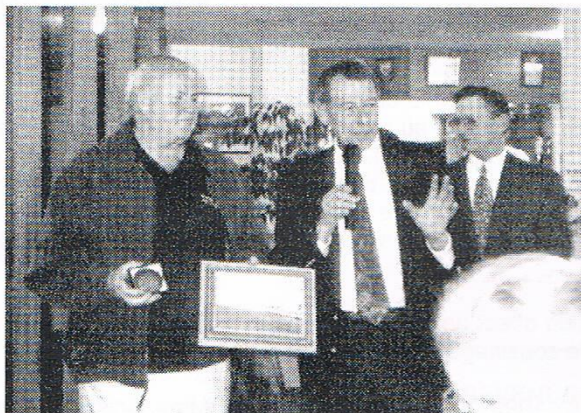
A Dieppe lors du banquet.