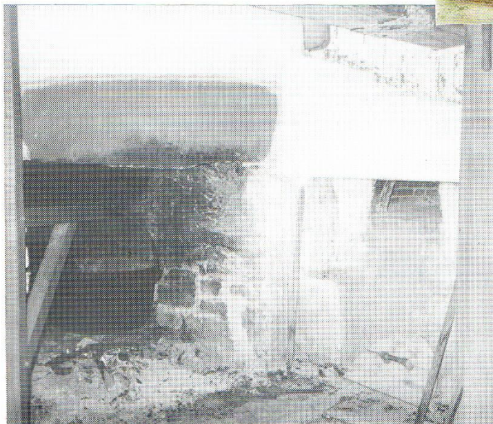
Foyer et four à pain, été 1998