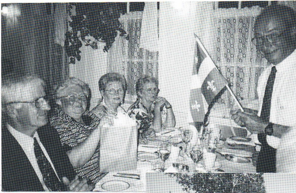
Banquet et soirée au Manoir Charlevoix