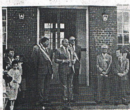
Devant les Asselin assemblés, les discours des officiels célèbrent la mémoire de leurs ancêtres.