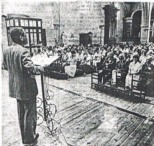
Ancelin de France et Asselin du Québec ont fêté leurs retrouvailles à La Rochelle où leurs ancêtres s'embarquèrent il y a deux siècles • photo Stéphane Izard.